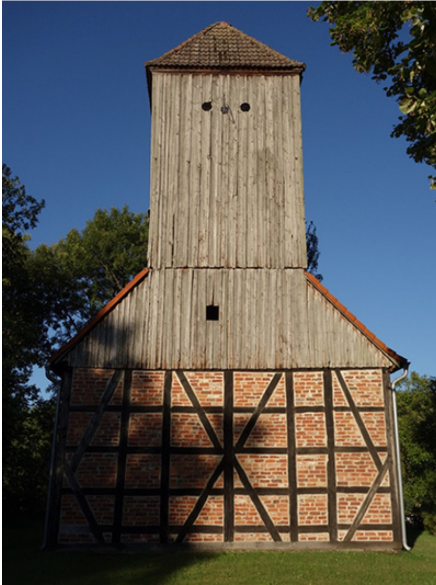
Kirchturm Bürsenhagen Westgiebel

In der Anlage können Sie aktuelle Fotos sowie einen Entwurf zur geplanten Öffnung des Ostgiebels sehen.