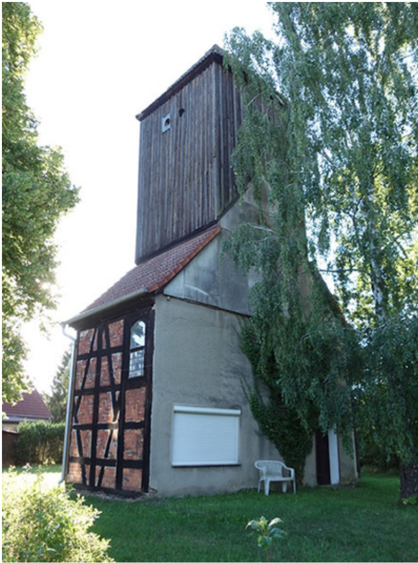
Kirchturm Brüsenhagen Ostgiebel