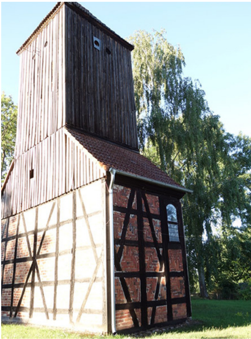
Kirchturm Brüsenhagen Südgiebel